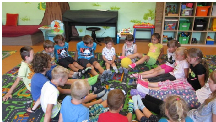
Obliíbené příměstské tábory v Majáku podpořil program OPZ

Výzvy sledujte na www.masrt.cz , informace: solcova@jiretinpb.cz (tel. 728 685 085).