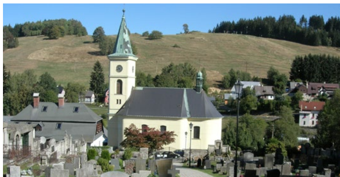
Opravený kostel v Albrechticích v Jizerských horách

zpracování 10 programů rozvoje obcí a 1 programu rozvoje Mikroregionu Tanvaldsko.