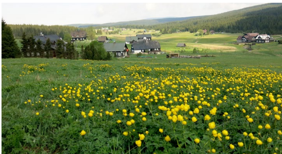
Osada Jizerka s loukami plnými rozkvetlých upolínů