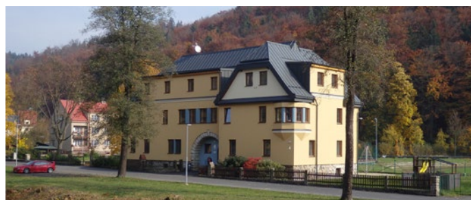
V rekonstruované budově staré školky ve Velkých Hamrech je nyní kuchyň s jídelnou, městská knihovna a tři klubovny