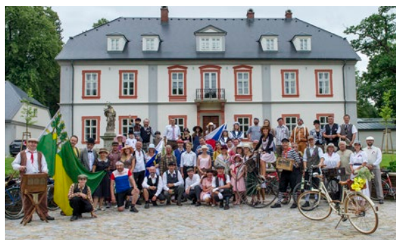
Loňská spanilá jízda Cyklostezkou Járy Cimrmana