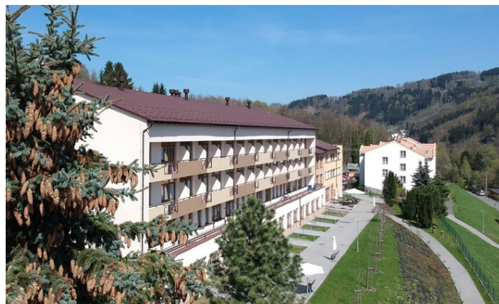
Domov důchodců Velké Hamry

Domov se zvláštním režimem pokrývá potřeby péče o seniory s různými typy demencí po celých 24 hodin. Individuální potřeby těchto obyvatel domova mohou být naplněny díky zvýšenému počtu pracovníků, kteří se tak mohou věnovat doprovodům na společné aktivity, na vycházky, atd. S aktivizační pracovníci také spolupracují na dopoledním i odpoledním programu oddělení. Obyvatelé mají většinou potřebu být v kontaktu s jedním člověkem, což jim nové oddělení umožňuje. Zvýšená pozornost je věnována bezpečí uživatelů služby, takže je třeba respektovat uzavření oddělení. Navštěvovat lze obyvatele stejně jako v domově seniorů. Zvýšená péče se týká hlavně orientace a sebeobsluhy uživatele. Personál se snaží nácvikem zachovávat co nejdéle schopnosti sebezpečí a po ztrátě těchto schopností se věnuje naplnění volného času uživatelů a pomoci v sebeobsluze.