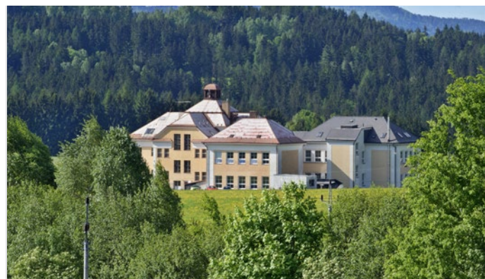
Dotaci na rekonstrukci učebny získala i škola v Zásadě

MAP II se oproti jedničce liší v tom, že je více zaměřen na pořízení výstupů pro pedagogy do škol (modernizace učeben). Vzdělávací semináře pro pedagogy nyní nebudou zastoupeny v takovém množství. Výše dotačního příspěvku je závislá na počtu žáků ve škole či školce. Školy mohou prostřednictvím tzv. šablon požádat například o školního pedagoga, asistenta, psychologa, vzdělávání pedagogického sboru, vzájemnou spolupráci pedagogů, nové metody ve výuce, zapojení ICT techniky do výuky a mnoho dalších.