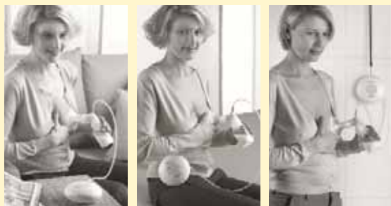
Možnost použití na stole, uchycení na pásek nebo pomocí šňůrky zavěšení na krk