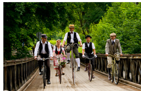
Cestovní ruch oživuje i akce pro veřejnost

V oblasti rozvoje cestovního ruchu je to například široká spolupráce DSO Mikroregion Tanvaldska, Turistického regionu Jizerské hory, společnosti JIZERKY PRO VÁS, o. p. s., a Železniční společnosti Tanvald, o. p. s., s podnikateli. Díky ní je koordinován rozvoj udržitelného cestovního ruchu a zkvalitňuje se turistická nabídka pro zimní i letní období, podporuje se rozvoj cykloturistiky, turistické i dopravní infrastruktury, vznikají nové nabídky zážitkové turistiky a společně se přistupuje i k propagaci.