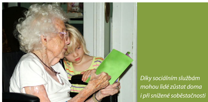
Díky sociálním službám mohou lidé zůstat doma i při snížené soběstačnosti

Cílem Svazku obcí Mikroregion Tanvaldsko je zmapovat potřeby lidí v území také v sociální oblasti a naplánovat stoprocentní pokrytí celého území dostupnými terénními pečovatelskými službami . To znamená, že na základě zjištěných potřeb bude nutné zajistit pro všechny potřebné občany pečovatelskou službu. Lidé, kteří patří do okruhu osob nacházejících se v nepříznivé sociální situaci, budou díky