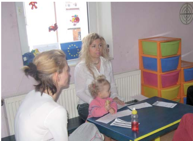
Společné vzdělávání maminek, Akce – Umíme si hrát.

Liberecký kraj – Počátky vzniku Oblastní charity v Liberci sahají do roku 1992, kdy byla založena původně Farní charita Liberec, složená z několika příslušníků libereckých římskokatolických farností. V srpnu 1998 byl přiznán Farní charitě profesionální statut a v roce 2001 byla přeregistrována Ministerstvem kultury ČR na Oblastní charitu Liberec. Od 1. ledna 2006 se Oblastní