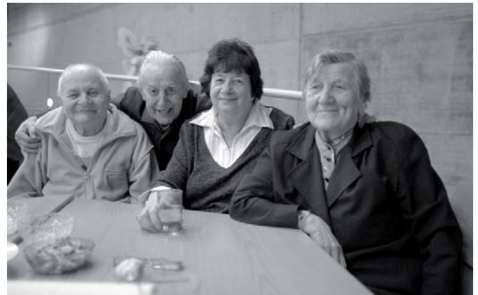
Židovská obec Liberec – Purim 2010.