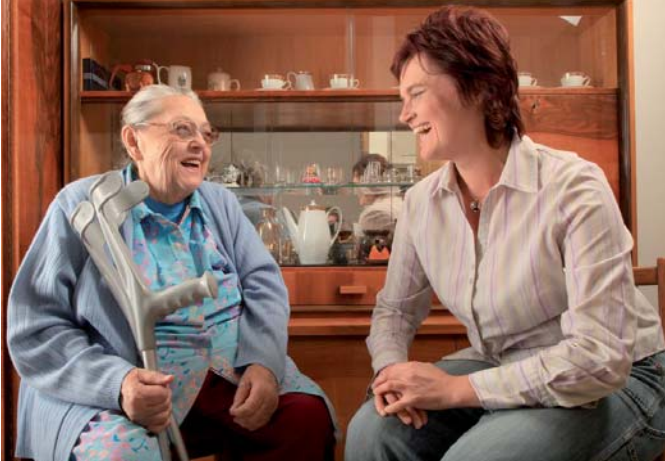
Uživatelka našich sociálních služeb s pečovatelkou.

Mnichovo Hradiště/Liberecký kraj – Staráte se o své staré rodiče či prarodiče? Potřebujete si občas něco zařídit, nakoupit nebo prostě jen „vypnout“ a odpočinout si, ale není nikdo, kdo by se mezitím o Vašeho blízkého postaral? Nebo sami cítíte, že Váš věk s sebou již přináší určitá omezení? Hůře se Vám samotnému obléká, nejste si jisti zvládnutím hygieny, neodvážíte se sejít sami po schodech nebo jít ven na procház-