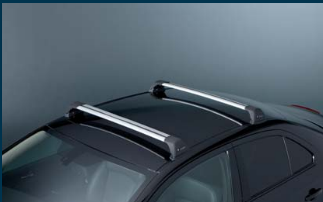
3 | Základní střešní nosič 1 Oválné hliníkové trubky, s uchycením do T-drážky Obj. čís. 990E0-57L33-000