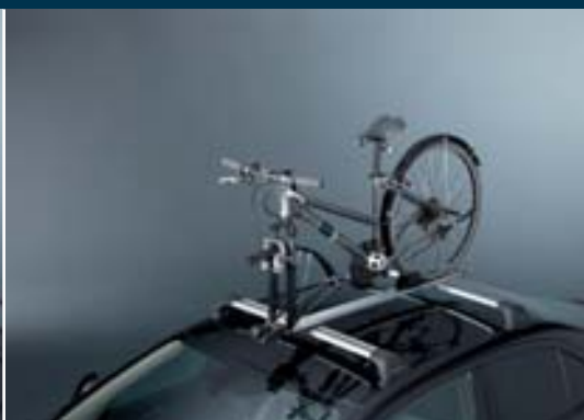
2 | Střešní nosič jízdních kol 1 pro transport jízdního kola s demontovaným předním kolem. Obj. čís. 990E0-59J21-000