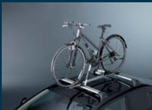
1 | Střešní nosič jízdních kol 1 pro transport kompletního jízdního kola. Obj. čís. 990E0-59J20-000